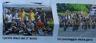
I primi dieci del 2° anno